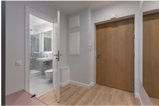
Ilustrācija 4 – Īpašuma plāns un attēli