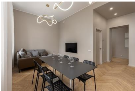
Ilustrācija 4 – Īpašuma plāns un attēli

Saskaņā ar Īpašuma iepriekšējā īpašnieka sniegto informāciju, Īpašums ticis izvietots īstermiņa īres platformās no 2023.gada Jūnija vidus. Šajā periodā Īpašums ticis izīrēts ar vidējo Īpašuma īres cenu līdz EUR 155,- par nakti. Pašreizējais pieprasījums īstermiņa īres platformās liecina, ka cena ap EUR 150,- par nakti ir ilgtspējīga sezonas cena, savukārt EUR 100,- par nakti ir ilgtspējīga nesezonas cena, kas atbilst Emitenta pieņēmumiem par plānoto īres cenu – skatīt sadaļu 17. – PEĻNAS PROGNOZES VAI APLĒSES .