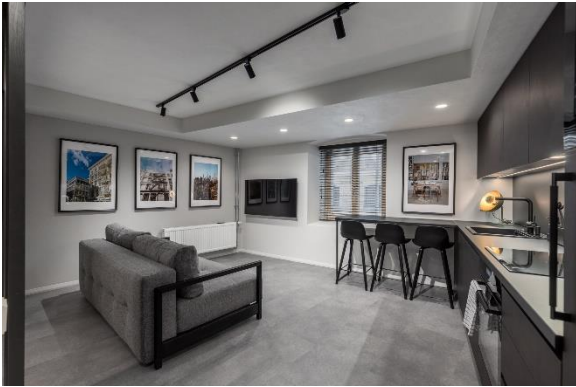
Ilustrācija 4 – Īpašuma plāns un attēli