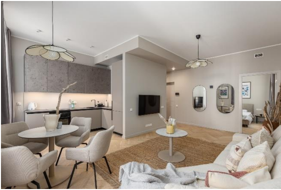
Ilustrācija 5 – Īpašuma plāns un attēli